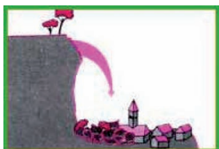
Fig.3 : le risque majeur

RISQUE : Combinaison d'enjeux soumis à un aléa.