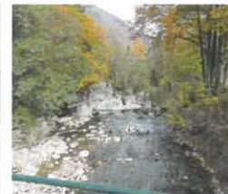
Lit du torrent du Bravon