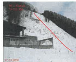
Avalanche du Petit Mont

Cette révision porte sur les phénomènes naturels d'avalanches, de mouvements de terrain et de débordements torrentiels.