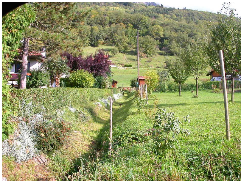
Ayze-OT2 : Ruisseau des Millièrès dans la plaine – Large fossé entretenu dans la plaine.