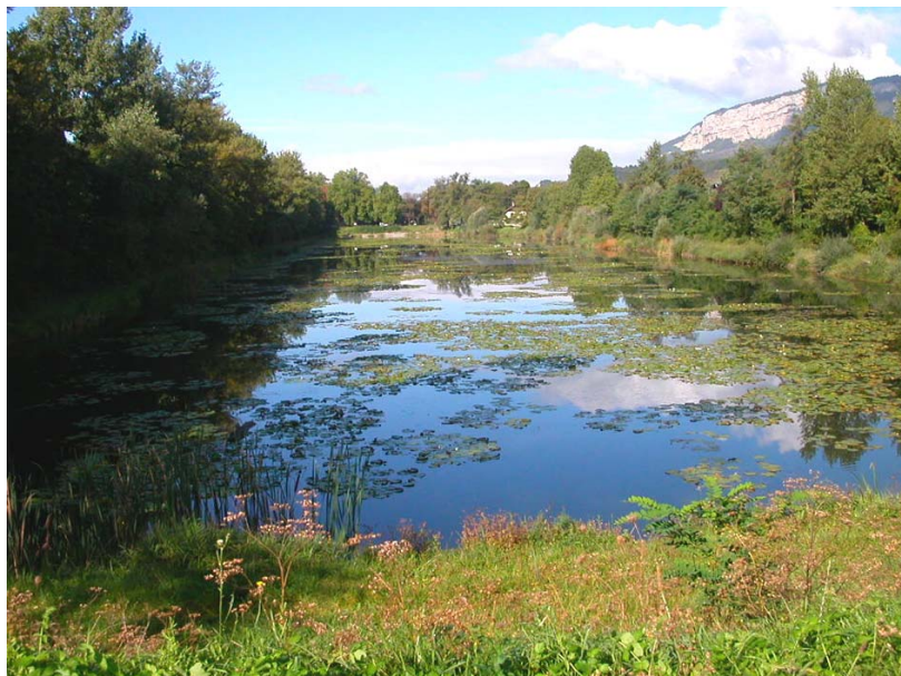
Ayze-EH1 : Lac communal d'Ayze – Ancienne gravière réhabilitée.