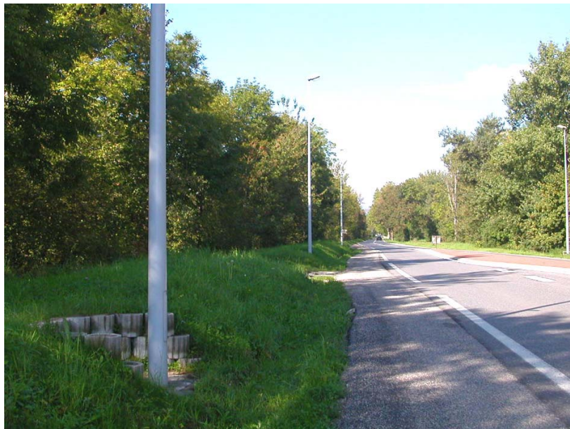
Ayze-OT1 : Rive droite de l'Arve, le long de la RD19 – Rehausse de la digue en bordure de route.