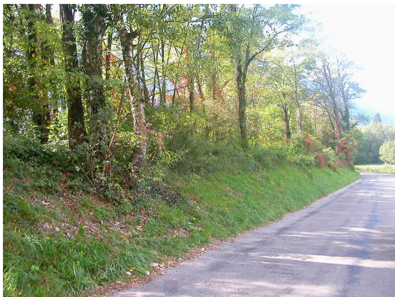
Ayze-ET1 : Ruisseau de la Madeleine en aval du chef lieu – Lit perché du ruisseau aux abords de la route.