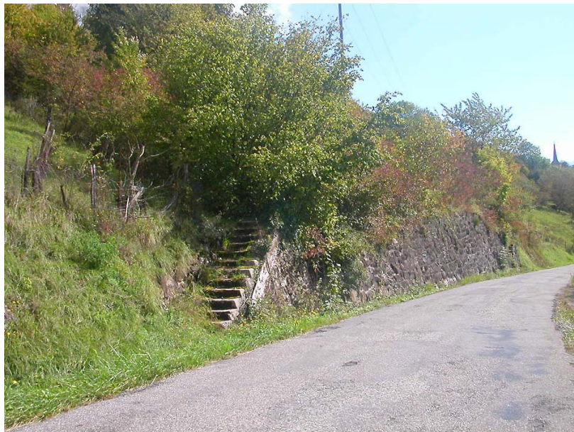
Ayze-OG1 : Les Merzières – Parcelles viticoles dont les talus sont confortés par des murets de pierre.