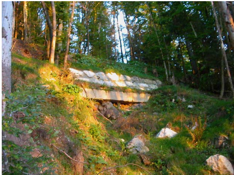
Ayze-EG1 : Route reliant les Guerzets à l'Eponnet – Dommages sur la chaussée et les ouvrages de confortement réalisés.