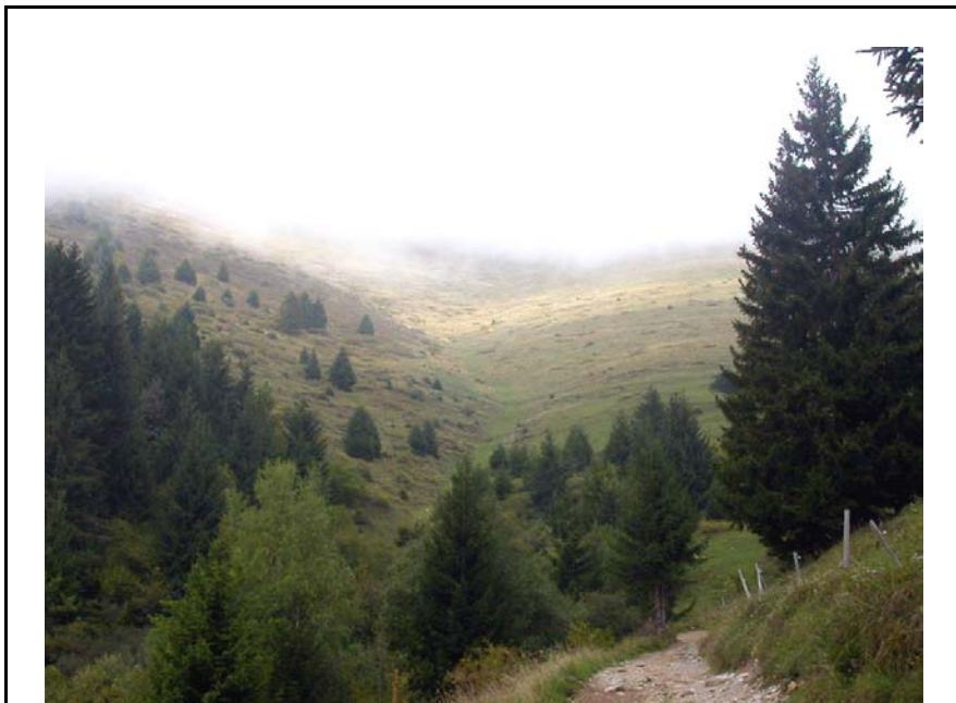
Ayze-EA1 : Versant Sud du Môle – Couloir d'avalanche répertorié dans l'EPA à l'Ouest de la Lardère.