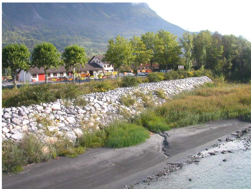
Ayze-OGT1 : Rive droite de l'Arve, au niveau de la ZAE du Bouchet – Protection de berges par enrochements.