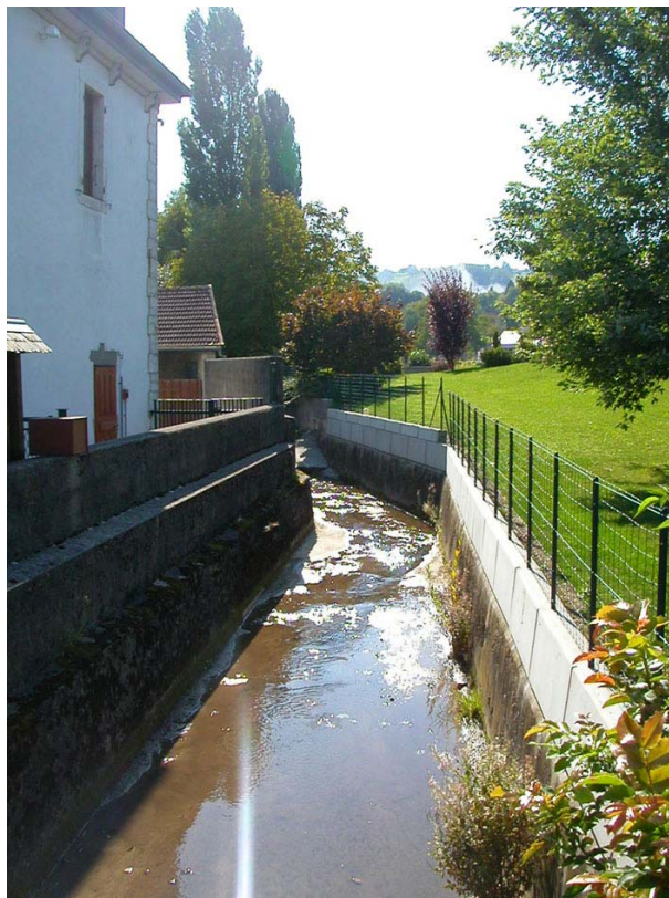
Bloye-OT3 : Ruisseau de Boiran – Lit canalisé le long de l'école.