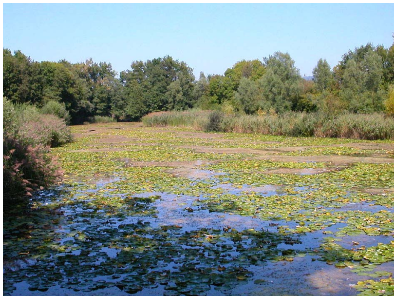
Bloye-EH2 : Etang de Crosagny – Partie en eau à l'extrémité Nord, en limite de commune.