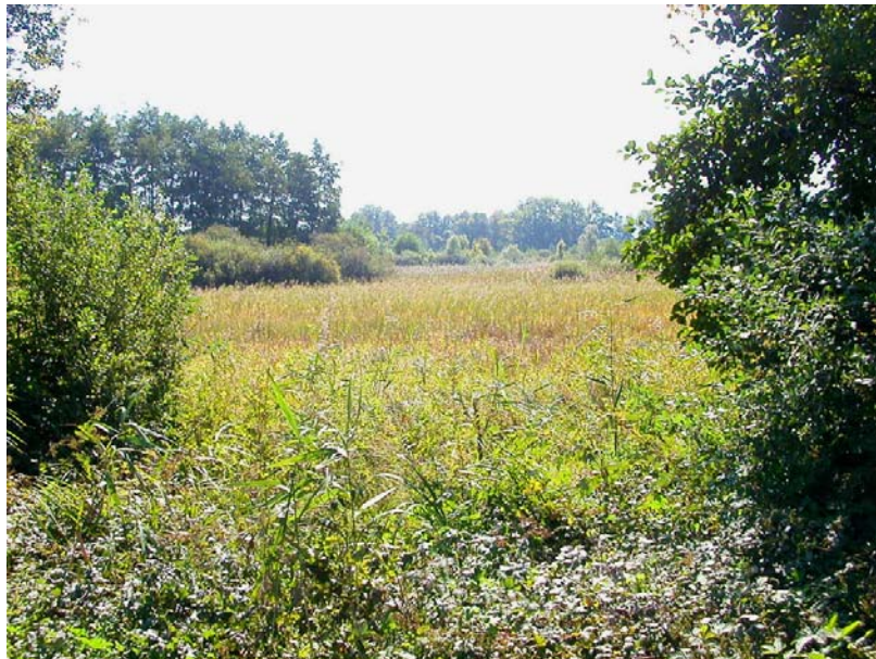
Bloye-EH1 : Etang de Beaumont – Secteur Nord moins humide, principalement composé de phragmites.