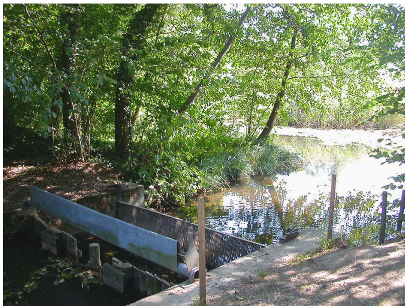
Bloye-OH1 : Entre les étangs de Crosagny et Beaumont – Vanne servant à réguler les écoulements entre les deux étangs.