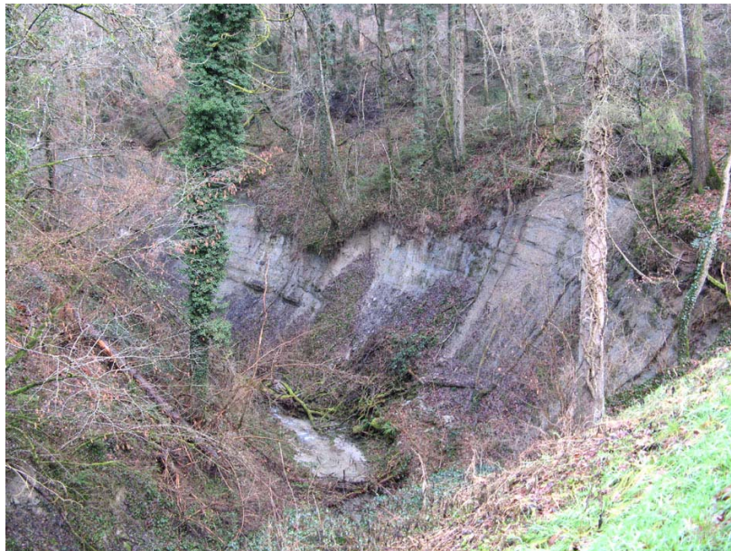
Boussy-ETG1 : Thalweg du Nant des Bornières – Creusement du lit dans les terrains molassiques.