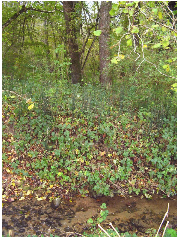
Boussy-EH1 : En limite Nord des Iles – Bordure de la zone humide boisée et riche en prêles.