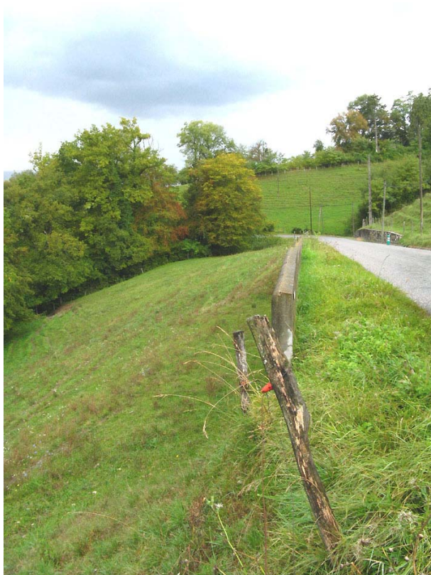
Boussy-EG1 : RD248, sous Mieudry – Zone d'anciens glissement.