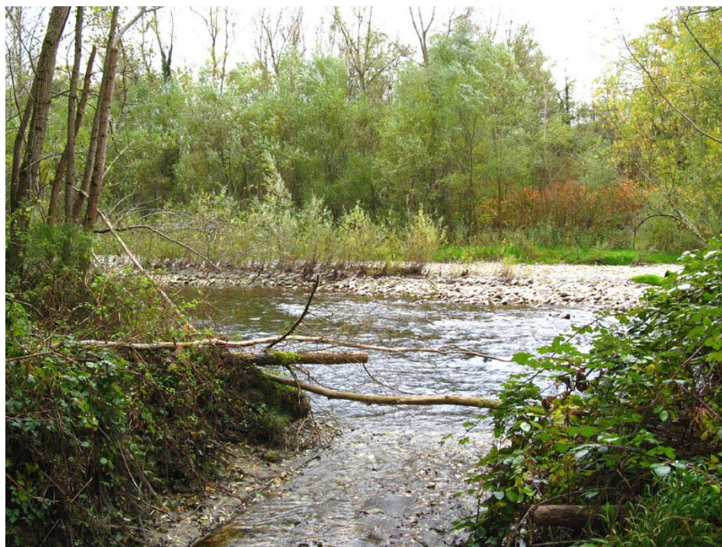
Boussy-ET2 : A la confluence Nant de Mieudry-Chéran (au Nord-Ouest de la commune) – Large lit de la rivière et berges inondables.