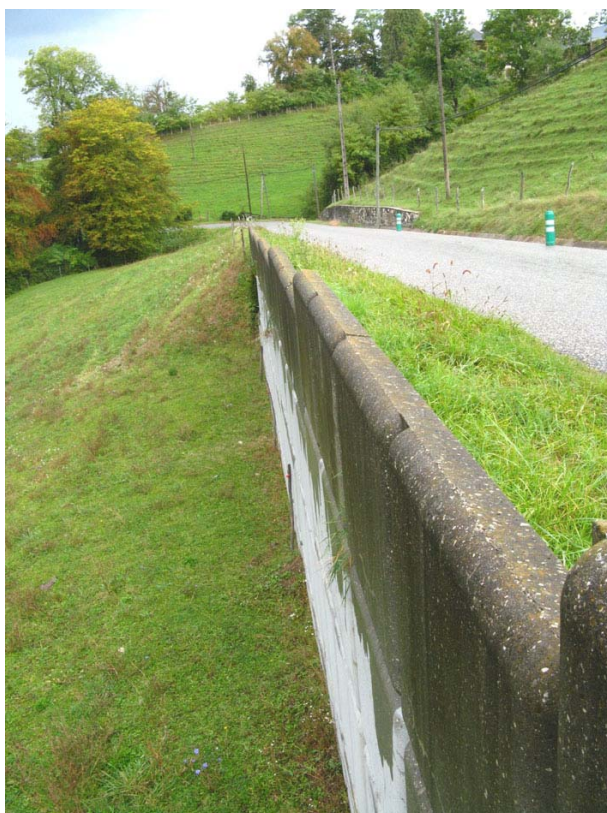
Boussy-OG2 : RD248, sous Mieudry – Zone d'anciens glissement confortées par des dalles de béton.