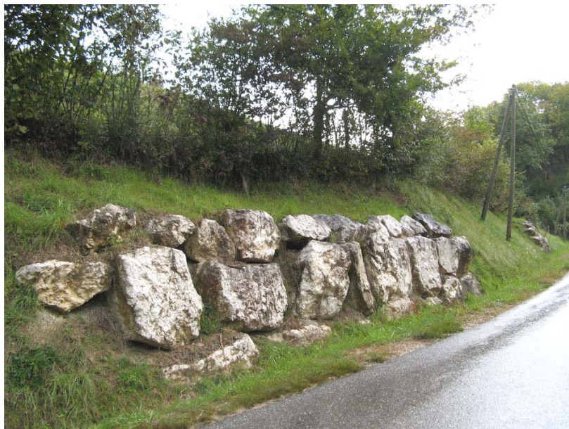
Boussy-OG1 : RD248, sous Mieudry – Confortement de talus par enrochements.