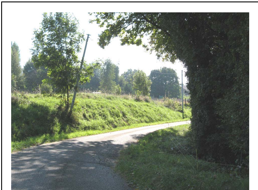
Chainaz-EG2 : Sous Mornant – Route impactée par les mouvements qui affectent le thalweg situé en contrebas.