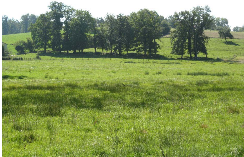
Chainaz-EH1 : Entre Chez Dupassieux et le Goléron – Zone humide peu développée (roseaux).