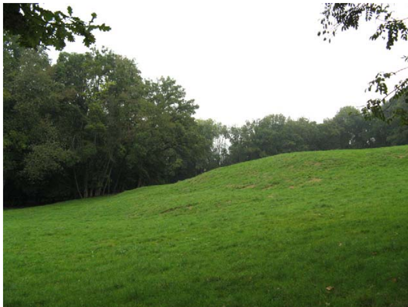
Chapeiry-EG1 : Entre Sciondaz et Vers les Bois – Topographie irrégulière mais stabilisée des prés (anciens phénomènes de fluage).