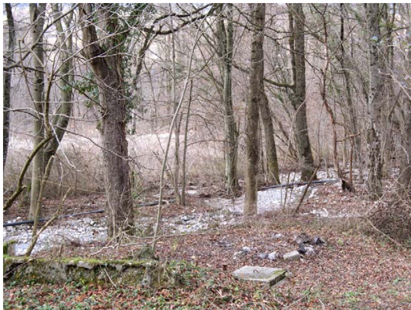
Vulbens-ETG1 : Ruisseau descendant sur les Gittes – Traces de divagations torrentielles et d'engravements à la rupture de pente.