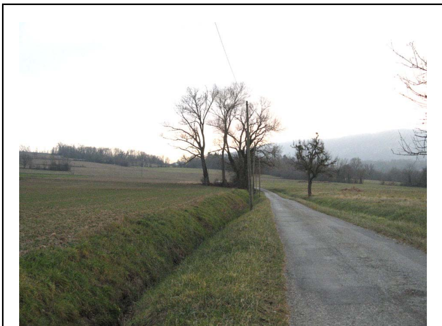
Vulbens-OT1 : Champs au pied de la Montagne du Vuache – Réseau de fossés de recueil des eaux pluviales bien développé et entretenu.