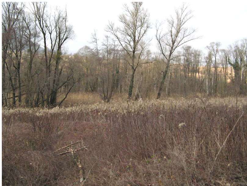
Vulbens-EH1 : Les Gittes – Zone humide située le long des berges du Rhône.