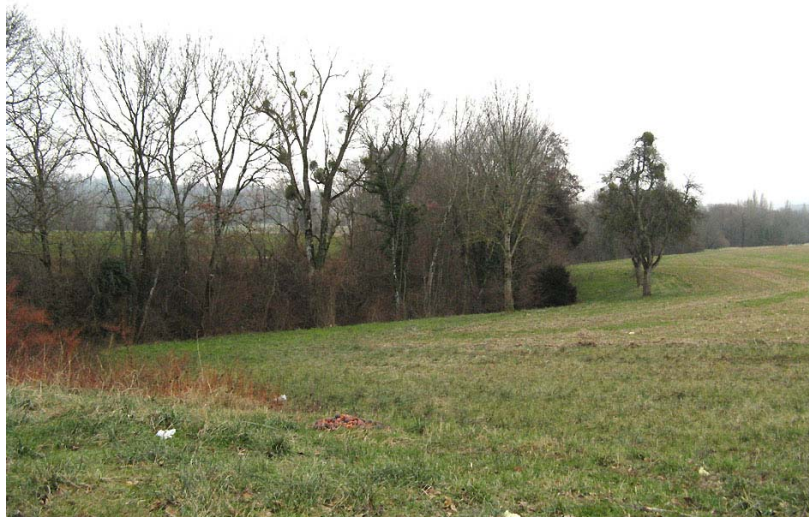
Vulbens-ETG2 : Nant d'Hiver, aux abords de la RN206 – Encaissement dans un thalweg boisé étroit.