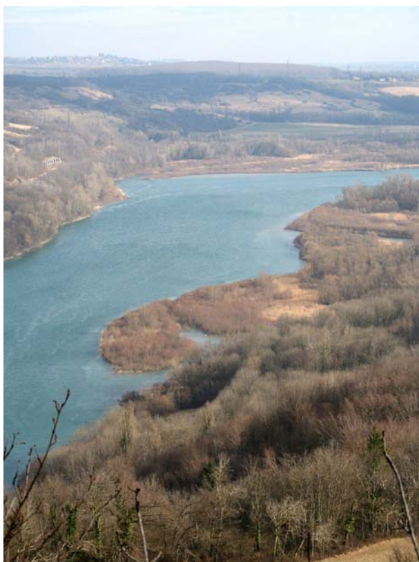
Vulbens-EH2 : Berges du Rhône – Vue d'ensemble sur toutes les zones humides en rive gauche.