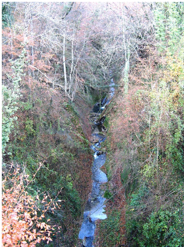
Valdefier-ET1 : Ruisseau d'Essert, à l'Est de Chavanne – Ecoulement dans des gorges.