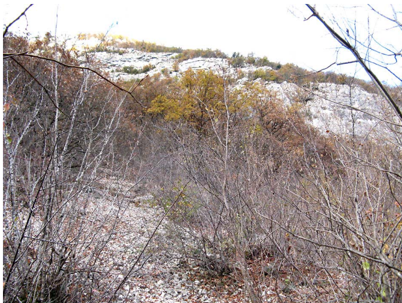
Valdefier-EP4 : RD14, au point coté 345m – Versant occupé de fins éboulis calcaires stabilisés par la végétation.