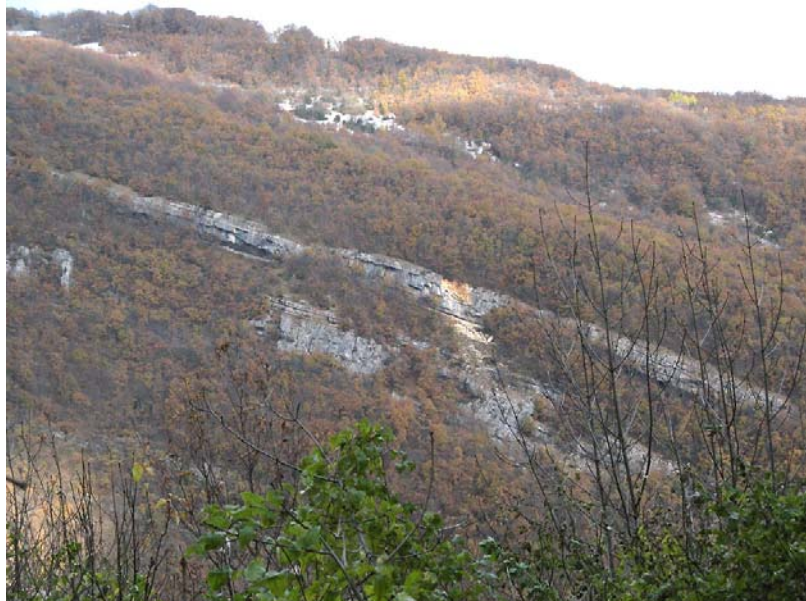
Valdefier-EP3 : Défilé de Val de Fier – Traces d'éboulements au niveau des barres rocheuses qui dominent la RD14.