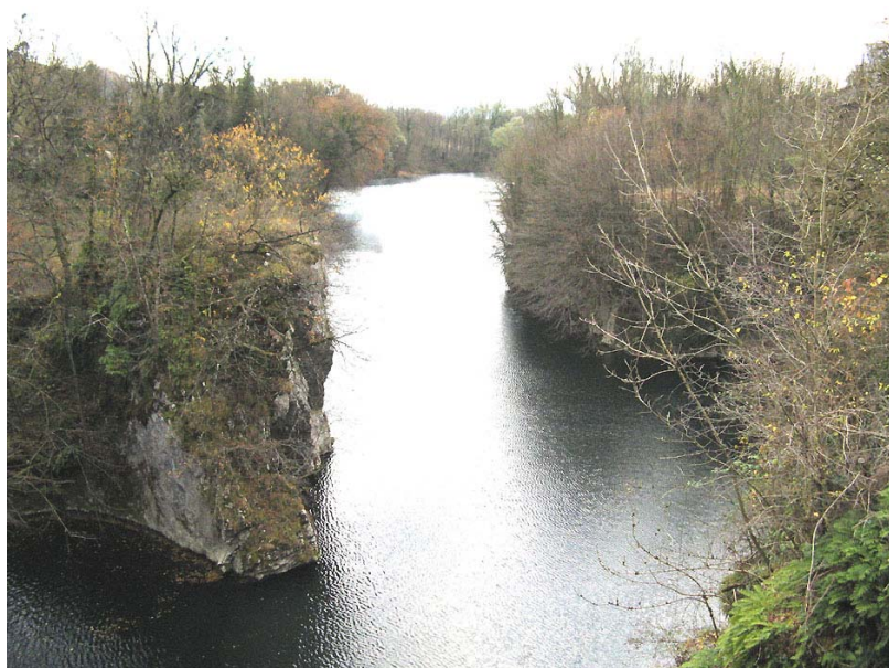
Valdefier-ET2 : Rivière du Fier, en amont du Pont de Saint-André (RD31) – Entrée des gorges.