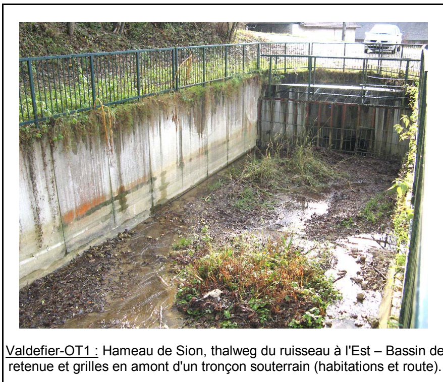
Valdefier-OT1 : Hameau de Sion, thalweg du ruisseau à l'Est – Bassin de retenue et grilles en amont d'un tronçon souterrain (habitations et route).