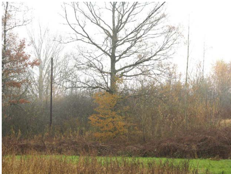
Droisy-EH1 : La Tuilière – Zone humide diversifiée délimitée par des levées de terres.