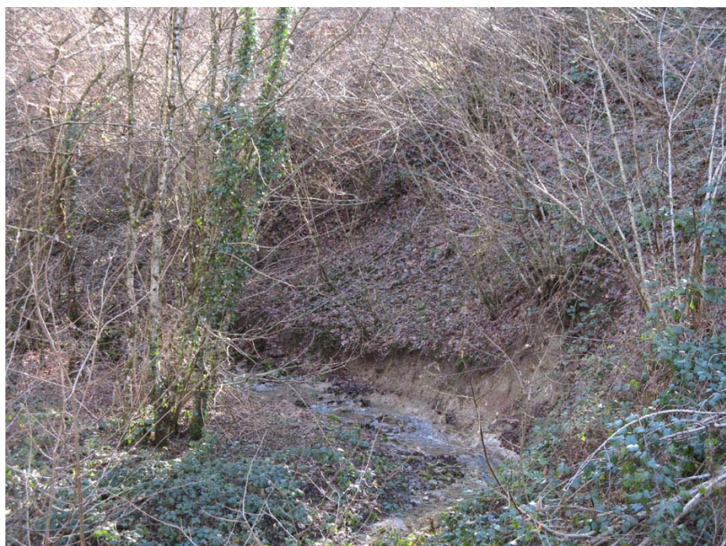
Droisy-EGT1 : Ruisseau de Vorcier – Affouillements et glissements de berges sur la rive gauche en amont de la RD17.