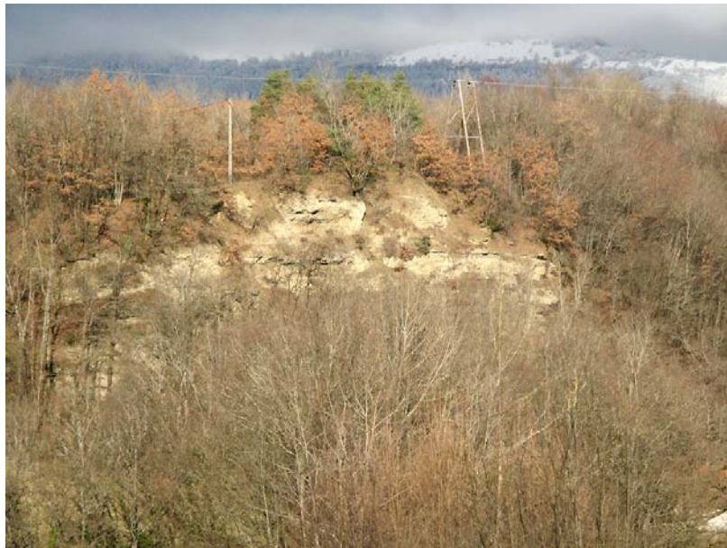
StGermain-EP1 : Versant en rive gauche – Creusement du thalweg et affleurement de la roche mère.