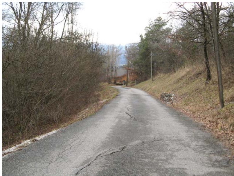
StGermain-EG3 : Thalweg au Nord-Ouest de Cernaz – Déstabilisations des versants du thalweg et affaissements localisés de la chaussée.