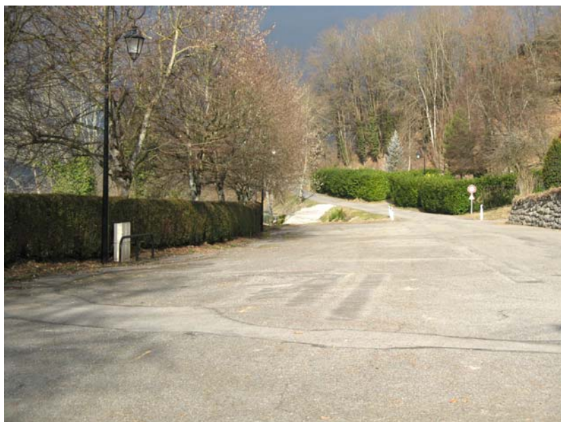
StGermain-EG4 : Parking de l'église de Saint-Germain – Affaissement progressif de la chaussée d'une trentaine de centimètres.