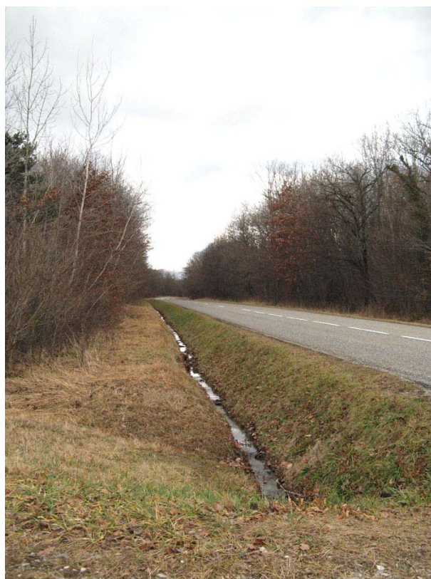
StGermain-OH1 : RD168 – Larges fossés recueillant les eaux pluviales et celles des zones humides.