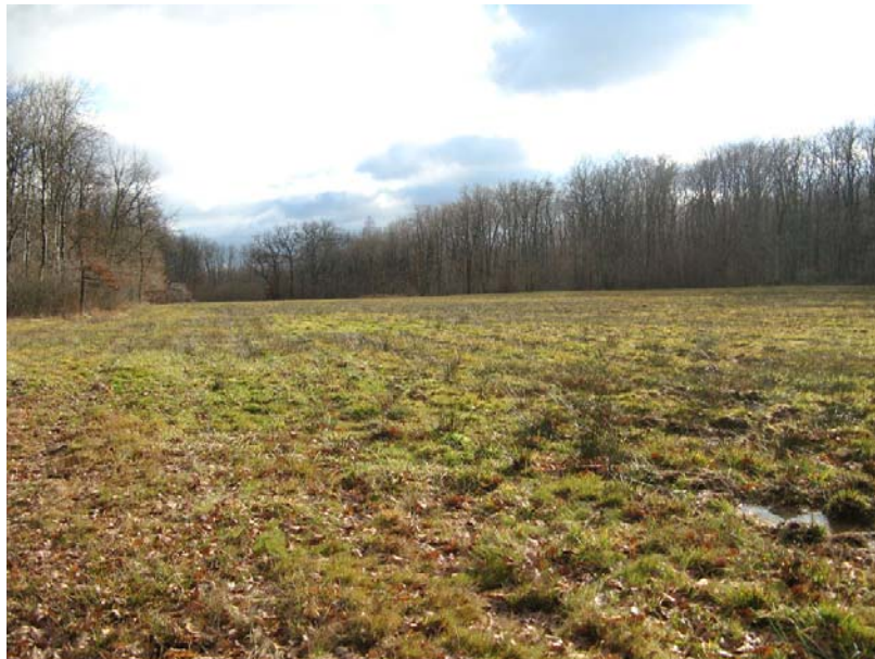
StGermain-EH1 : Les Marais – Prairie humide étendue (roseaux).