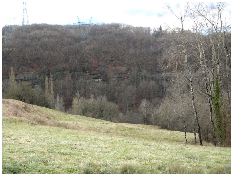
StGermain-EGP1 : Sous Cernaz – Signes de mouvements dans les prés – Affleurement de la roche mère dans le thalweg.