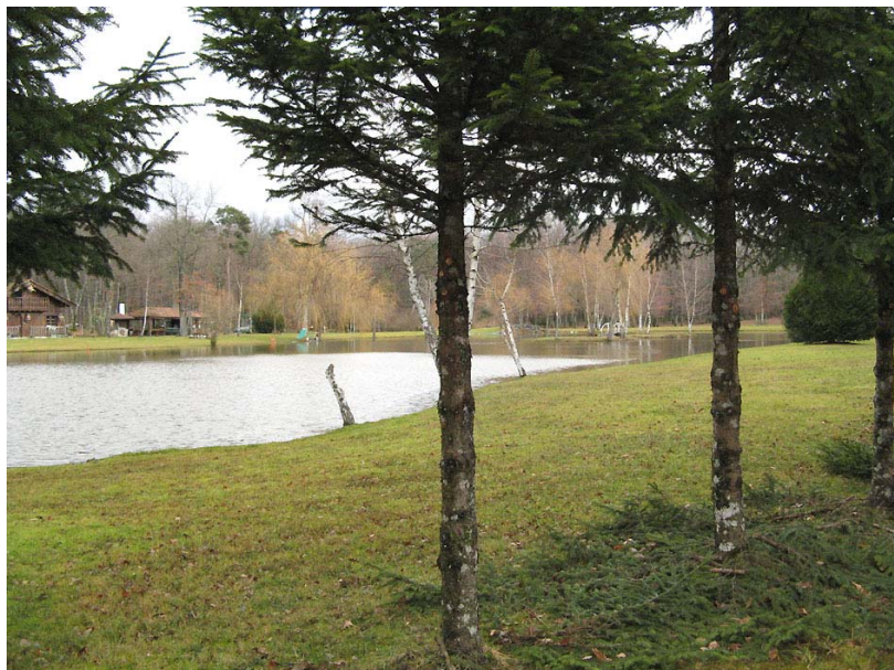
StGermain-EH2 : Les Marais – Zone humide réaménagée en étang privé.