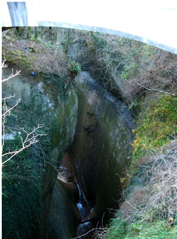
Lornay-ET2 : Sous le pont de Bauriant – Profondes et étroites gorges creusées dans les terrains molassiques.