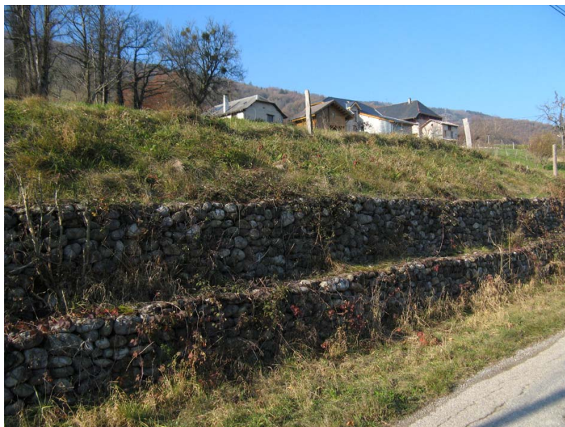
Lornay-OG1 : Sous la Bâtie – Gabions pour conforter le talus amont de la route.