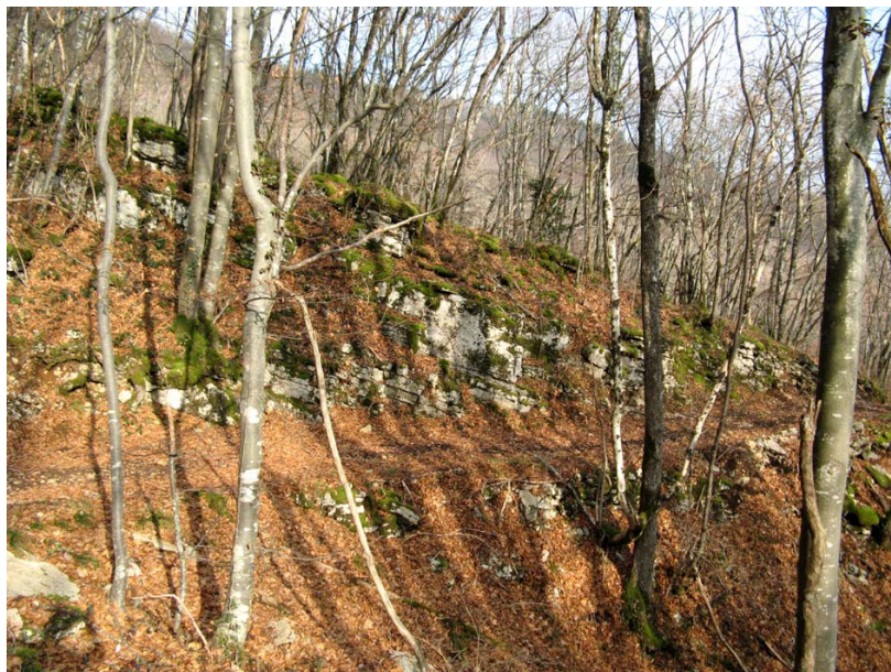
Lornay-EP1 : Vers Reufet, dans le bois communal de Lornay – Affleurements calcaires fracturés.