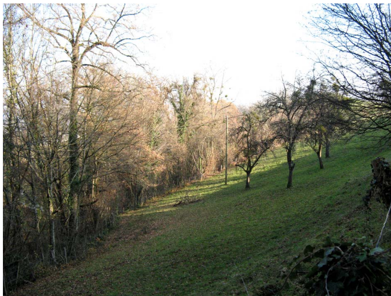
Lornay-EG1 : Thalweg entre la Bâtie et Hauteret – Signes de déstabilisations au niveau de la rive droite (arbres penchés).