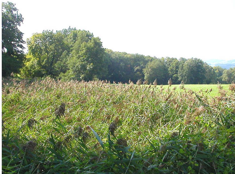
Marigny-EH1 : A l'Est du Château de Saint-Marcel – Zone humide (phragmites) dans la combe devant le château.