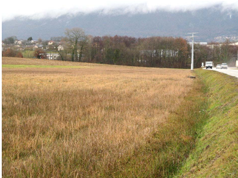
Marigny-EH2 : Le long de la RD3, à la limite de commune – Importantes circulations d'eau favorisant le développement d'une jonchaie.