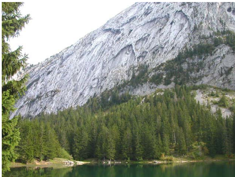
Marnaz-EP2 : Lac Bénit – Parois du Petit Bargy.