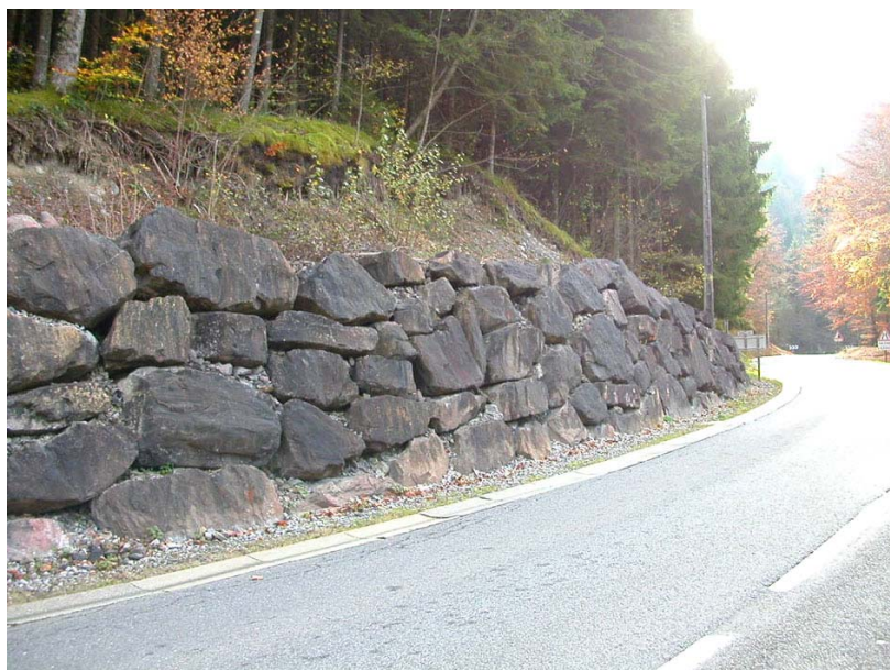
Marnaz-OG1 : RD286, au niveau du pont de la Bonnaz – Confortement de talus par enrochements.