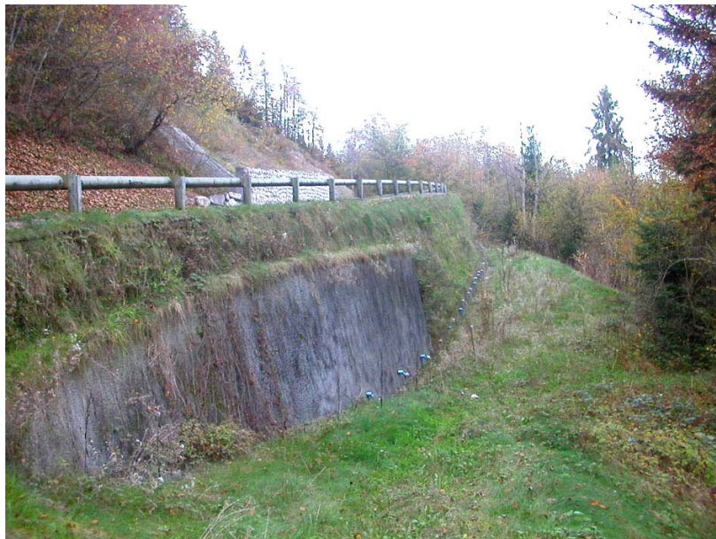
Marnaz-OG2 : RD286, en amont du pont sur le Foron de Marnaz – Mur de confortement aval drainé.