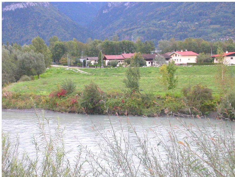
Marnaz-ET1 : L'Arve en rive gauche, au niveau des Valignons – Berges laissées libres à l'écoulement des crues.