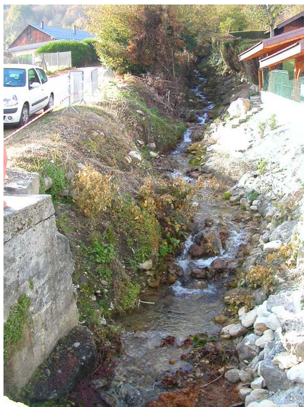
Marnaz-ET2 : Ruisseau du Chêne, vers Hermy – Confortement de berges en amont du pont.