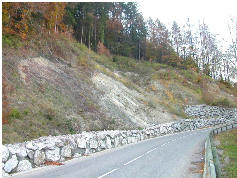
Marnaz-OGP1 : RD286, en amont du pont sur le Foron de Marnaz – Enrochements, filets grillagés et ancrages pour stabiliser le talus.