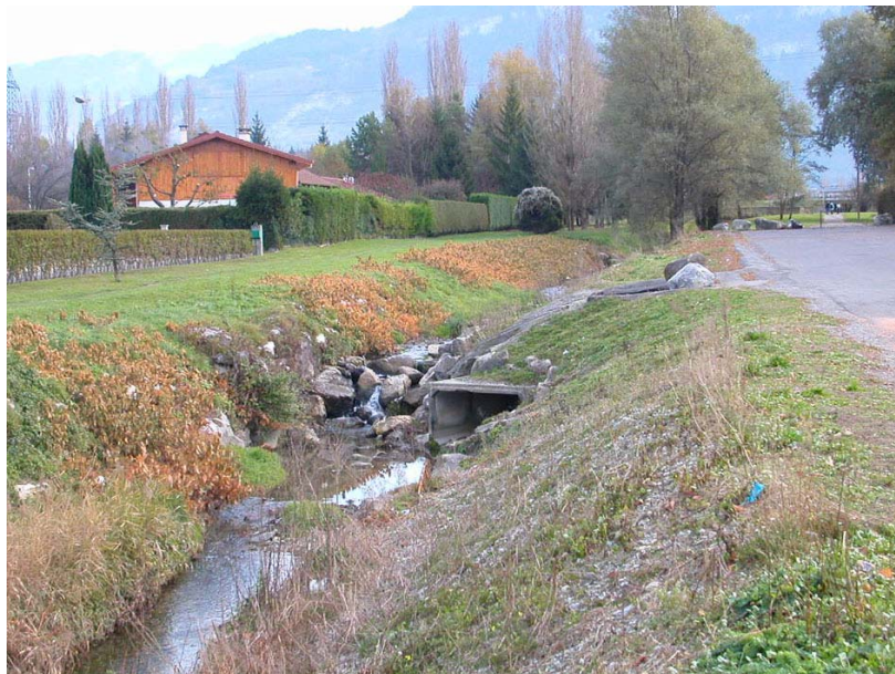
Marnaz-OT3 : Le Foron de Marnaz, à l'amont de sa confluence avec l'Arve – Large fossé entretenu et localement conforté.