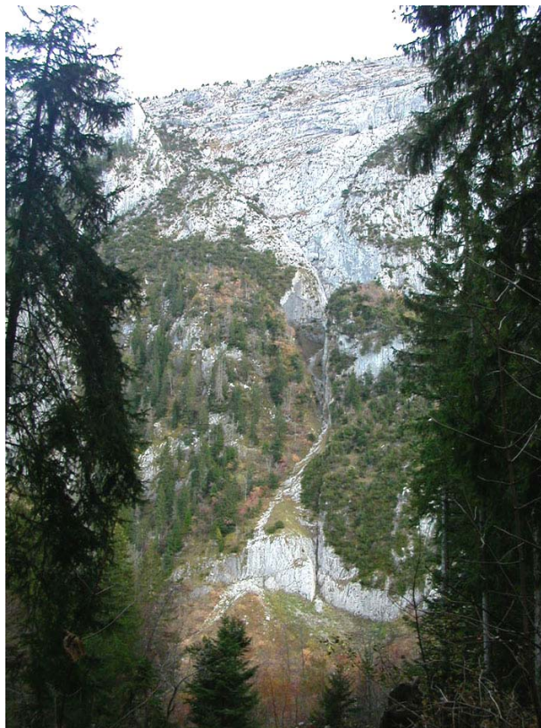
Marnaz-EP1 : Au pied du Petit Bargy – Eboulis accumulés sous des couloirs au pied des falaises.