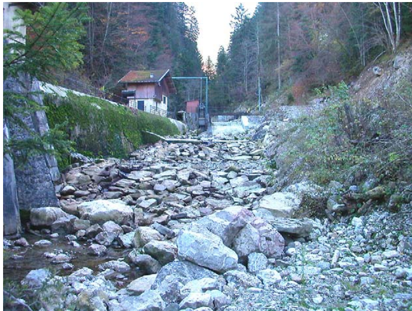
Scionzier-ET1 : Gorges du Foron du Reposoir – Large lit encombré de rochers et déstabilisation importante des berges.