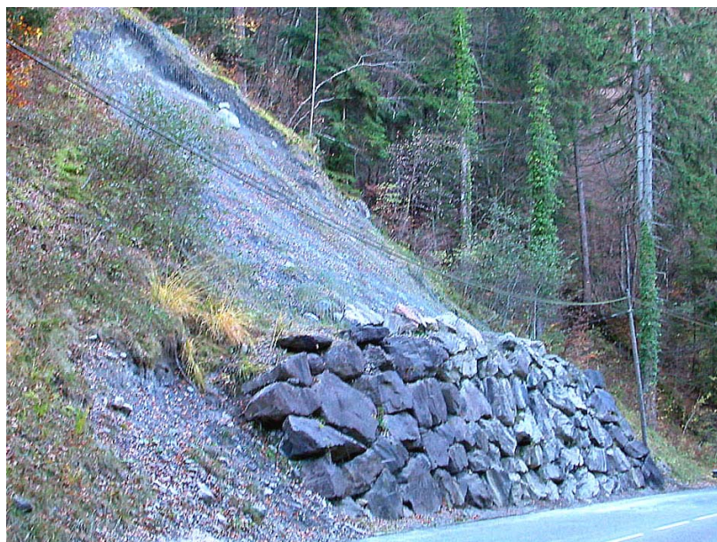
Scionzier-OG4 : RD4, au niveau du ruisseau des Bottes – Enrochements de talus déstabilisés et protection ce la chaussée par filets grillagés.