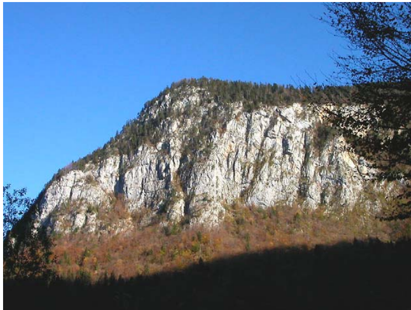
Scionzier-EP1 : Rochers de Tête Naz – Parois fracturées au dessus d'un versant largement boisé.