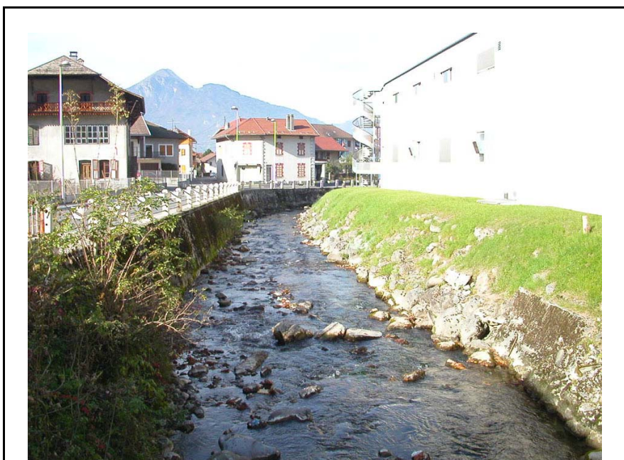
Scionzier-OT2 : Le Foron du Reposoir, à Miosinge – Confortement par murets en rive gauche et enrochements en rive droite.