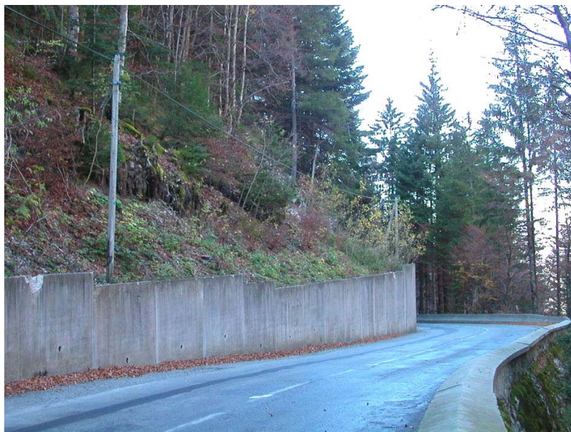
Scionzier-OG1 : RD4, en amont de l'oratoire Notre Dame des Grâces, alt.860m – Confortement de talus par des dalles de béton drainées.