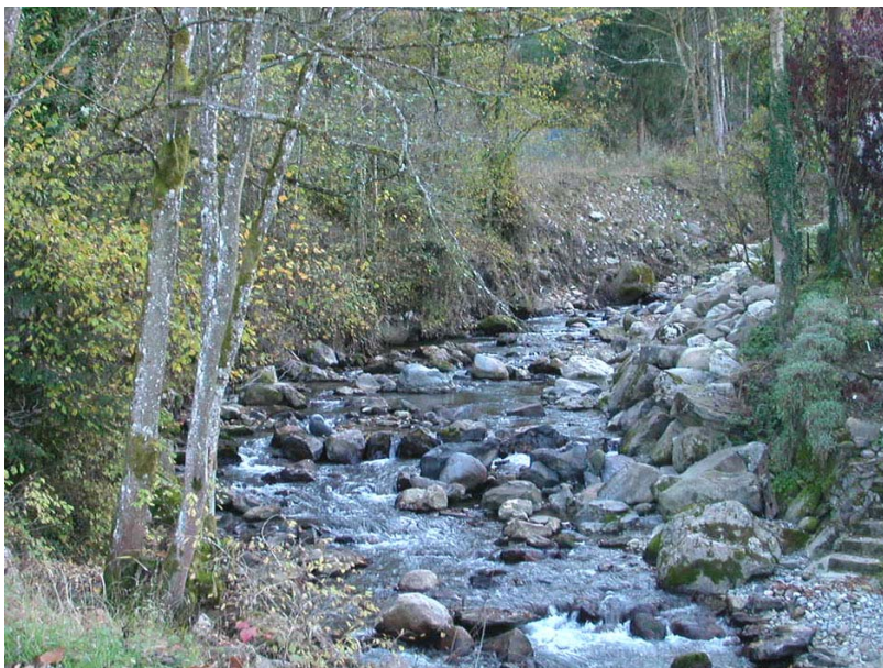
Scionzier-ET2 : Le Foron du Reposoir au Bourg Dehors – Large lit caillouteux et localement conforté par enrochements.