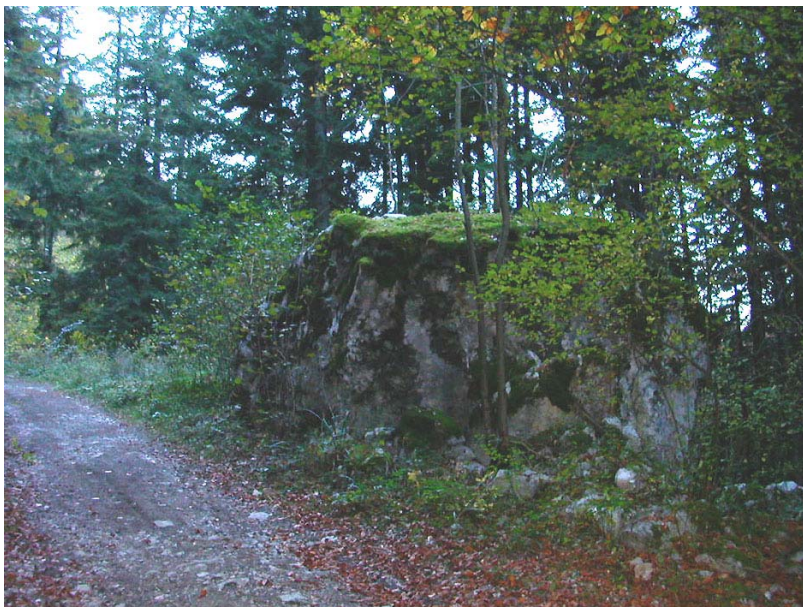
Scionzier-EP2 : Bois de Chamberon, au dessus de la Marinière – Traces d'anciens éboulements dans les sous-bois.