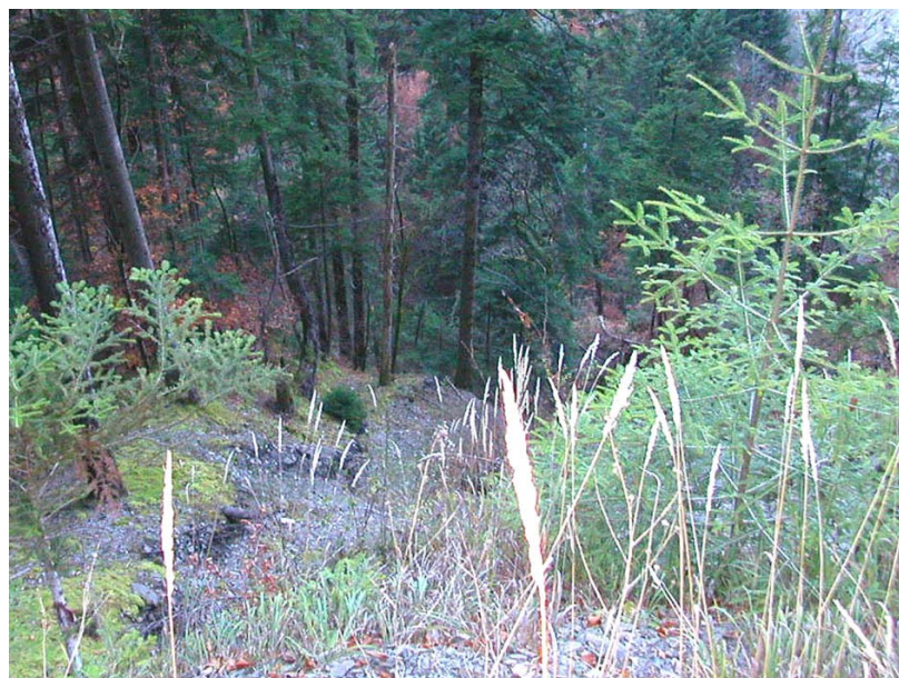
Scionzier-EGP2 : Dans les gorges du Foron du Reposoir – Glissements et ravinement du versant, localement stabilisé par sa couverture boisée.