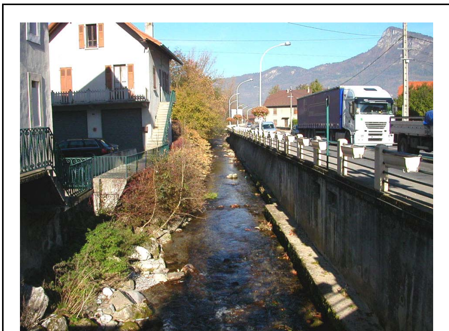
Scionzier-OT1 : Le Foron du Reposoir, à Scionzier – Berges consolidées par des murs de béton et de ciment dans sa traversée urbaine.