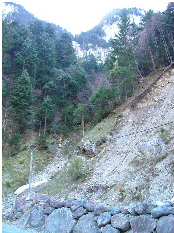
Scionzier-EGP1 : RD4, au pont du Nant – Déstabilisation active du talus.