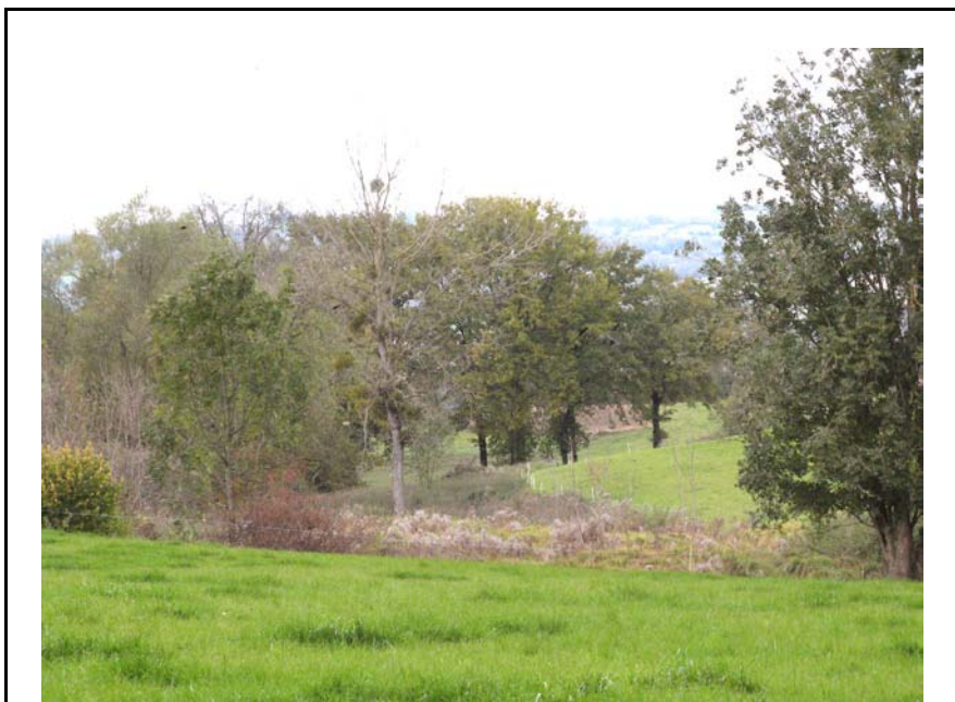
Sales-EH2 : Au Nord-Ouest de Clarafond – Zone humide alimentant un petit ruisseau.