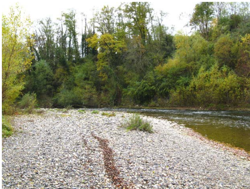
Sales-ET1 : Rive droite du Chéran, à l'Ouest du Moulin des Iles – Lit majeur de la rivière et débordements possibles sur ses berges.