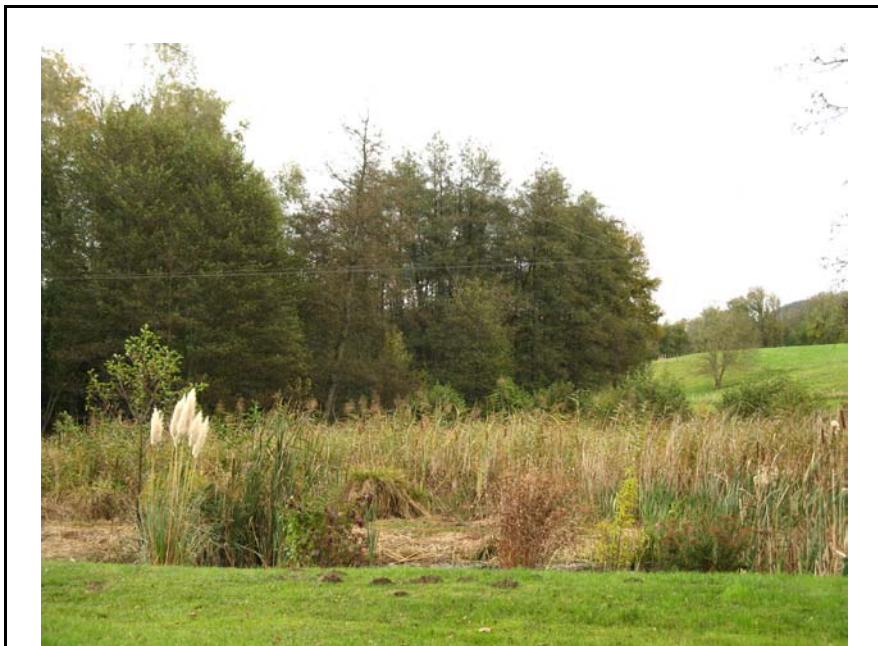
Sales-EH1 : Au Sud-Ouest de Germonex – Zone humide (phragmites) implantée dans le thalweg.