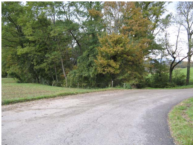
Sales-EG1 : Ravin boisé du Nant de Mieudry – Approfondissement brutal du thalweg du ruisseau.