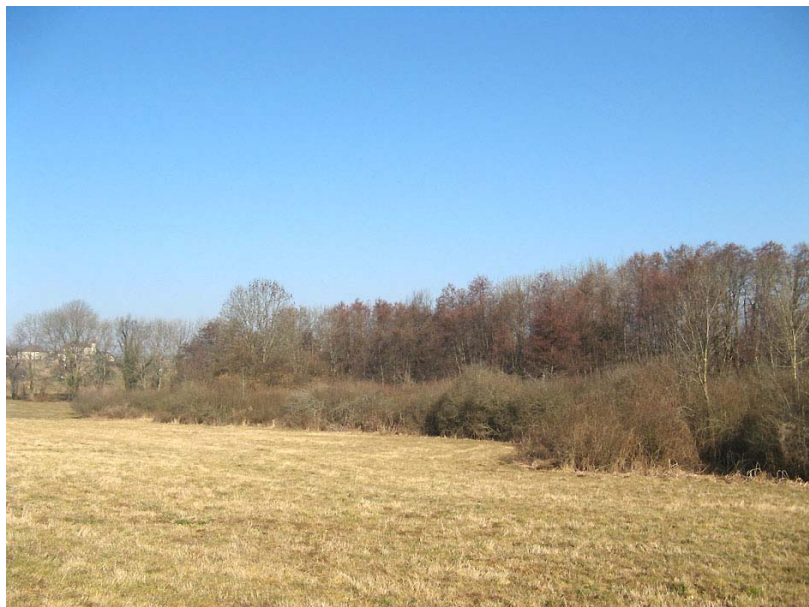
Choisy-EH1 : La Clef des Faux – Zone humide constituée d'une végétation variée (herbacées et arbres).