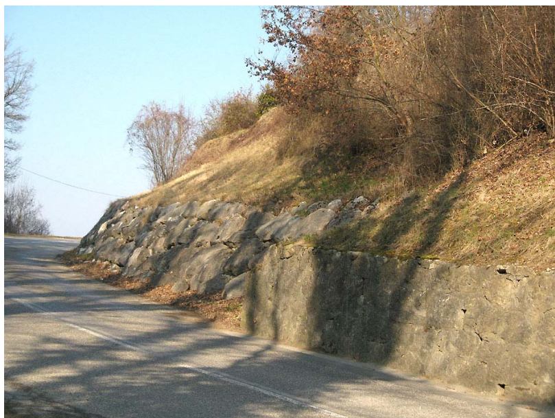
Choisy-OG2 : RD3, rive gauche du thalweg du ruisseau du Creux de Vallières – Confortement de talus par enrochements.