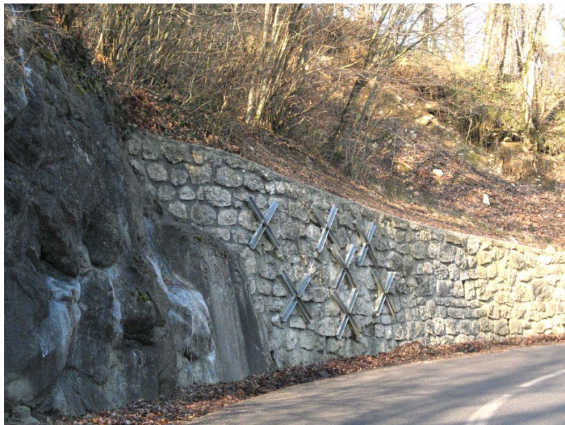
Choisy-OG1 : RD3, thalweg du ruisseau de Mallabranche – Cimentation de talus rocheux et confortement par pierres maçonnées et ancrages.