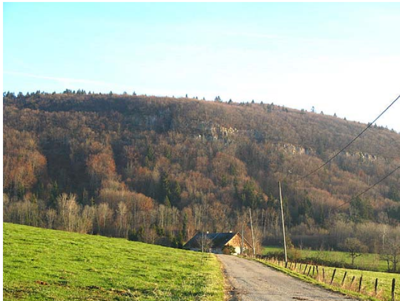
Choisy-EP1 : Versant au dessus de Chez Cadoux – Barres rocheuses fracturées, isolées sur un versant très boisé.