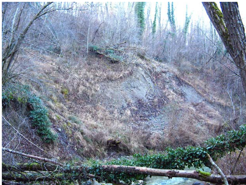
Choisy-EGT1 : Ruisseau des Petites Usses, le long de la RN508, au niveau de Buidon – Affouillement et glissements de berges.