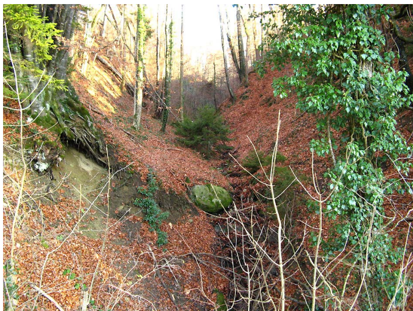
Choisy-EGT2 : Thalweg au Sud des Bourgeois, sous Bois Belin – Creusement d'un thalweg boisé localement déstabilisé.