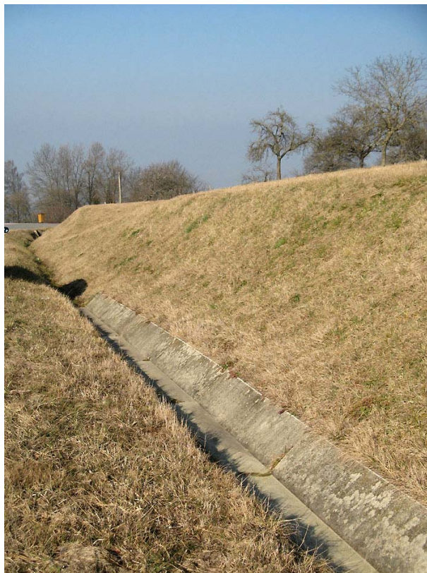
Choisy-OG3 : RD3, au dessus du chef lieu, sous Menulles – Recueil des eaux pluviales et de ruissellement le long de la RD3.