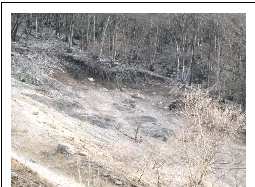
Clarafond-EP4 : RD908a, au Sud-Est de la carrière de la Plantaz – Versant boisé recouvert de fins éboulis rapidement érodés.