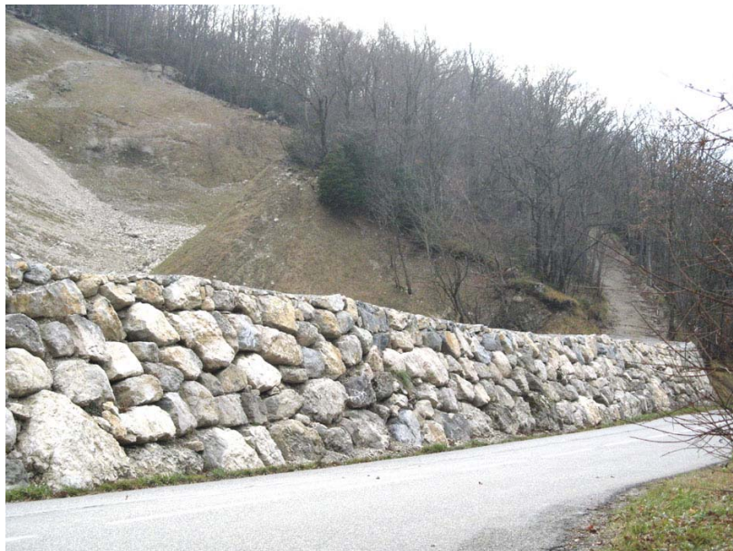
Clarafond-OP1 : RD908a, au dessus du point coté 378 – Merlon en enrochements.