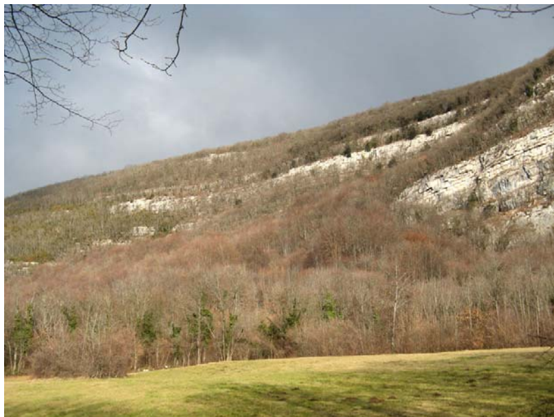
Clarafond-EP1 : Parking des Grandes Chises – Barres rocheuses fracturées sur le versant boisé entre le Golet du Pey et le Rocher Blanc.