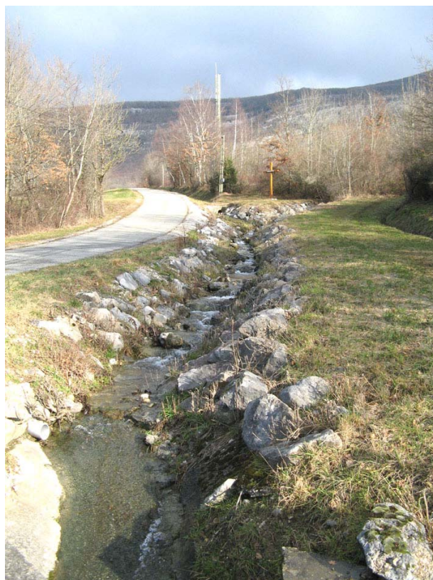
Clarafond-OT1 : Cours amont du ruisseau de Trainant en aval de l'A40, au Crêt du Feu – Aménagement du lit par enrochements des berges.