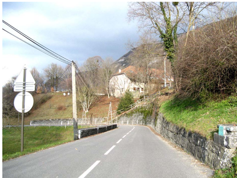
Clarafond-OG1 : RD908a, Arcine – Confortement de talus par des murs de pierres maçonnées.