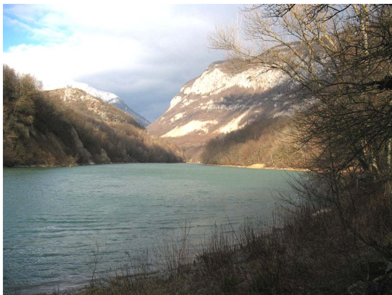
Clarafond-ET1 : Rive gauche du Rhône au niveau du Moulin – Cours du fleuve régulé par son exploitation hydro-électrique.