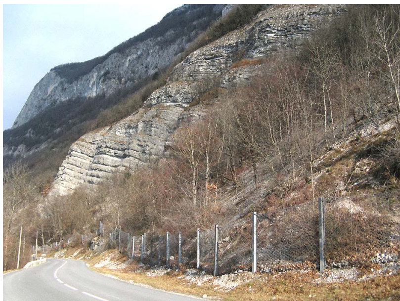
Clarafond-OP2 : RD908a, au Sud-Est de la carrière de la Plantaz – Ligne de filets pare-blocs au dessus de la chaussée.