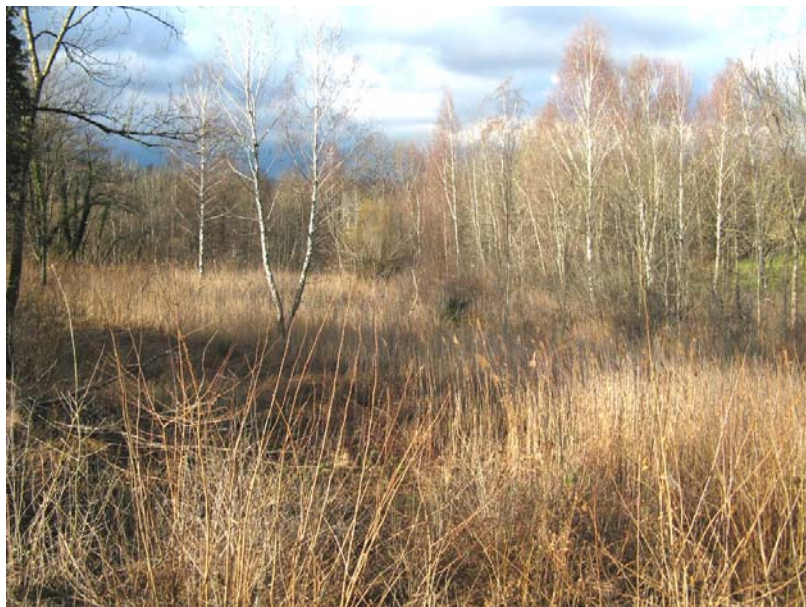
Clarafond-EH1 : Au Nord-Est de Quincy – Zone humide mi-herbeuse mi-boisée aux abords de sources captées.