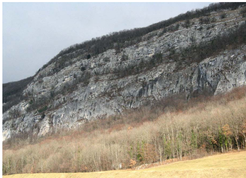
Clarafond-EP2 : Parking des Grandes Chises – Hautes falaises calcaires plus compactes sous le Rocher Blanc.